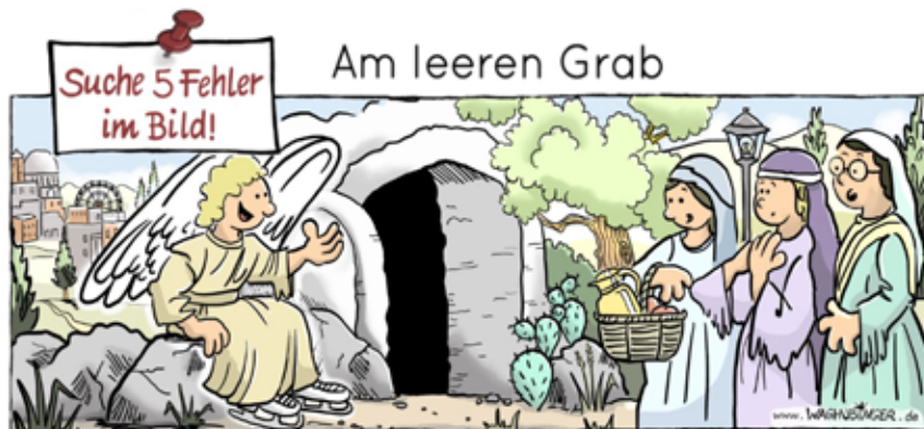
Riesensrad, Schlittschuher, Thermoskanne, Laterne, Brille

Anmeldungen und Kostenbeitrag werden auf dem Flyer bekannt gegeben.